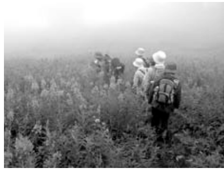
▲ヤナギランの群落を歩く