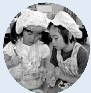
▲マヨネーズ作り 「まだまだかなあ」