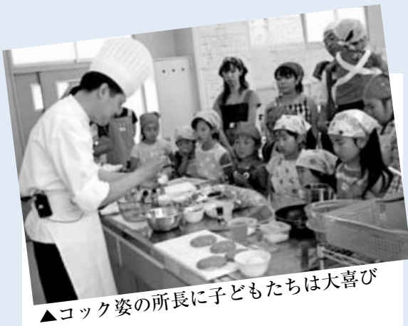
▲コック姿の所長に子どもたちは大喜び

加します。『味の教室』では小さなカップに入った食品を味見しながら、甘味、酸味、塩味、苦味などを感じたり、精製塩と自然塩、昆布とかつお節で作った吸い物とうま味調味料で作った吸い物などのブラインドテストに挑戦しました。