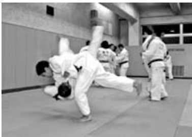
▲手稲区体育館での練習

準優勝の感想は、「ここまでいけるとは思っていなかっただけに嬉しいです。でも準優勝となるとやっぱり悔しい」と話し、続けて「ここまでの成績を残せたのは、自分ひとりの力ではなく、指導してくれた先生や、応援してくれたみんなのおかげです。期待に応えるためにも、練習を重ねてインターハイでは優勝を目指したい」と力強く目標を語ってくれました。