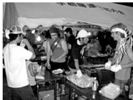
▲焼き鳥を焼く青年部の皆さん

このような活動を見てみると、育った「まち」への熱い思いが伝わってきます。地域の皆さんは、そんな若者たちの活躍を後押しし、温かく見守っています。