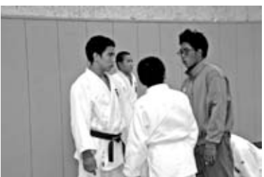
▲真剣な表情で指導を受けます