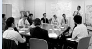
◀「前田の宝さがし」プロジェクト企画検討会議の様子

前田 まちセンでは、前田地区の魅力発見事業として「前田の宝さがし」プロジェクトを進行中です。こちらは所長が世話人となり、連合町内会や商店街振興組合、地区内の大学に通う学生など地域住民が主体となって事業の企画検討を行っています。初回は一人一人前田にある魅力的な場所、活動、人、もの、歴史など、どのようなものを宝とするかを挙げることから始めました。今後はより具体的な宝さがしの方法や、活用方法などについて検討していく予定です。