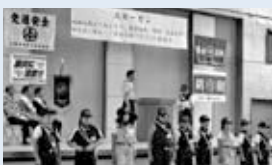
▲手稲中央少年消防クラブによる防火の誓い

手稲 地区では、7月8日に30回目の「安全な街づくり宣言大会」を行い、安全安心なまちづくりを目指すことを誓いました。今年も学校、町内会、まちセンが連携して、地区の小学生から安全安心にちなんだ標語を募集し、この大会で優秀作品の作成者に対し表彰が行われました。