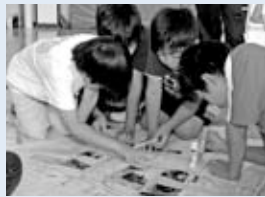
▲危険個所を地図に記入

新発寒 地区では、区内で、死亡交通事故、車上ねらいなどの犯罪、不審者の発生ならびに子どもへの声かけなどの問題が起きていることから、決意も新たに、地域の安全で安心なまちづくりを進めるため、7月に「第1回新発寒地区交通安全と安心・安全まちづくり大会」を開催しました。