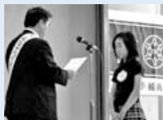
▲手稲区長から賞状の授与

手稲鉄北 地区では地域とまちセンが協働して、災害時における地域力向上のための図上訓練の普及や、ごみの不法投棄を含む環境問題に関する対応策を講じていくため、これらに関わる講演会などの開催について企画検討しているところです。