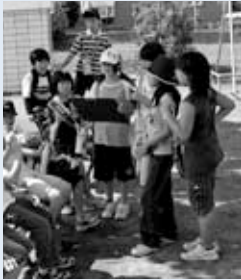
▲公園で危険な個所探し

稲穂金山 地区の手稲西小学校では、9月18日に子どもたちによる「セーフティマップづくり」が行われました。これは、子どもたち自身が実際にまちを歩き、身の回りの危険な個所を発見し、地図を描いていく過程を通じて、危険に遭わない力を育てようというものです。稲穂金山地区青少年育成委員会の方が企画し、取り組みを進めるにあたっては、まちセンが、将来にわたり地域が自主的に活動を続けていくためのきっかけづくりとしての支援を行いました。