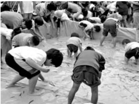
▲どじょうまつりの様子

8月初旬の「はしご酒大会」を皮切りに、「盆踊りまつり」「どじょうまつり」が次々と開催されましたが、そこにはいつも、この若者たちの顔がありました。ひた向きに動き回る姿はまぶしく、今