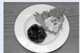
▲「ハンバーグとサラダ、上手にできました!」