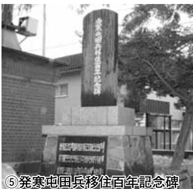
⑤ 発寒屯田兵移住百年記念碑