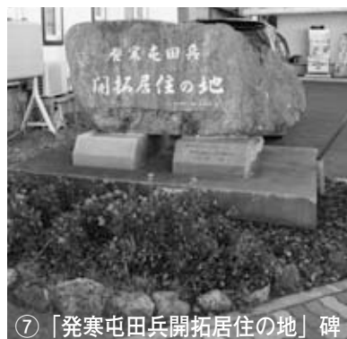
⑦ 「発寒屯田兵開拓居住地」碑