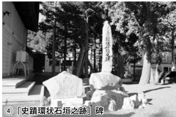
④ 「史蹟環状石垣之跡」碑