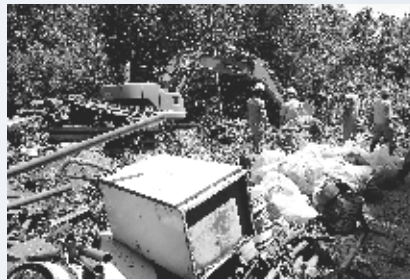
不法投棄ごみ撤去作業 (有明地区)

時は流れ、平成十六年八月、企業の産廃施設で違法が発覚。急転直下、十二月に設置許可申請を企業自ら取り下げ、六年の歳月を要した一件も落ち着いたのです。