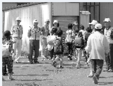
防犯ボランティア

「いつも守ってくれてありがとう。おかげで事故に遭わずに卒業できました」と小学校卒業式の帰りに卒業生から卒業証書を見せられ、涙が出るほど感激したという報告もありました。