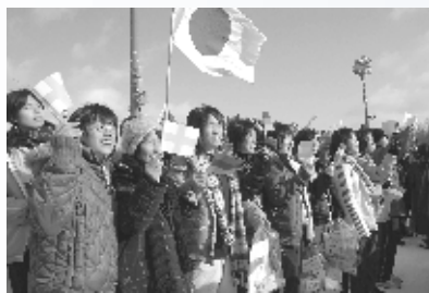
ノルディックスキー世界選手権札幌大会での応援 (白旗山競技場)

最後に、この十年間の最大の思い出は、ノルディックスキー世界選手権札幌大会が白旗山を会場に開催。熱戦が全世界に放映され、その同じ場所でも私たちが応援できたことです。