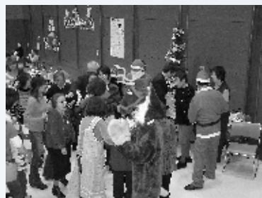
福まちの「お楽しみ会」

「福まち(福祉のまち推進センター)」の活動では、一人暮らしのお年寄りの支援活動を続けてきました。具体的には、高齢者の見守りと援助を基本に、ふれあいバス旅行、三代交流お楽しみ会など、また子育て支援として親子バス遠足、ミニオリンピック大会を実施しております。