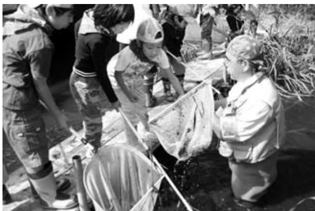
9月22日 東屯田川遊水地 どんな生き物がいるのかな？