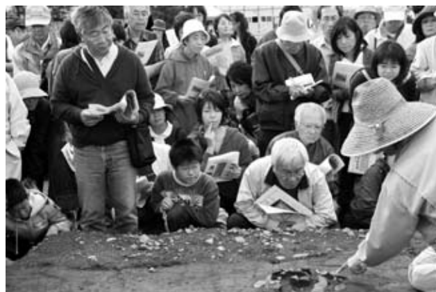
9月29日 札幌北高校グラウンド内 縄文時代の生活を想像しながら