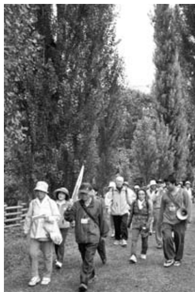
9月27日 北海道大学構内 深い緑に囲まれて