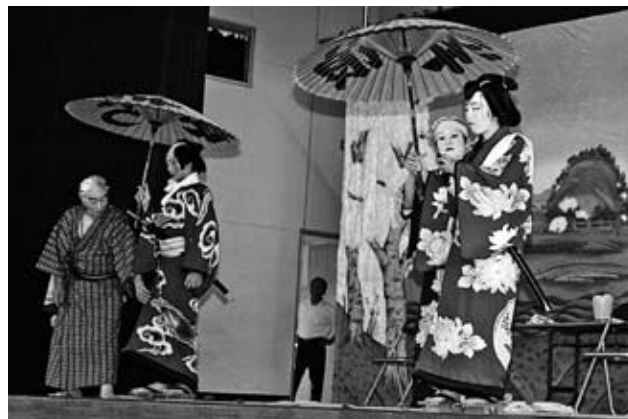
10月5日 新琴似中学校 中学生が歌舞伎体験