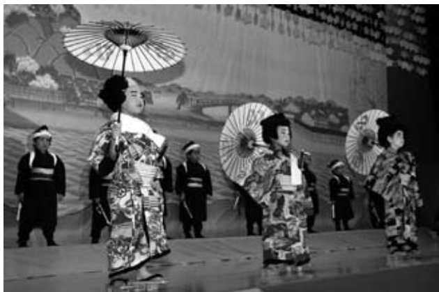
10月14日 篠路コミュニティセンター 小さな歌舞伎役者に拍手喝采