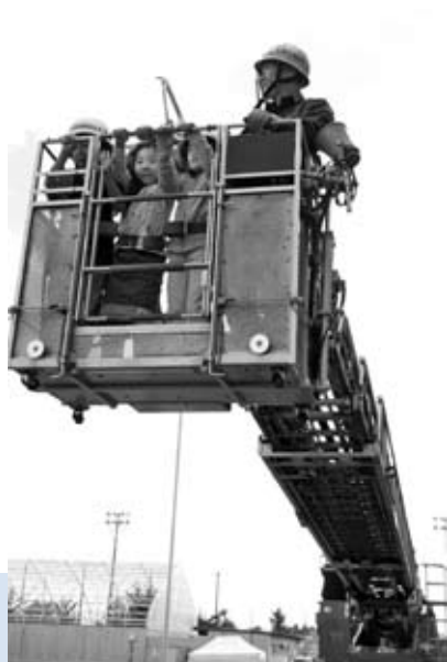
9月30日 新川小学校 あまりに高くて ちょっと緊張？