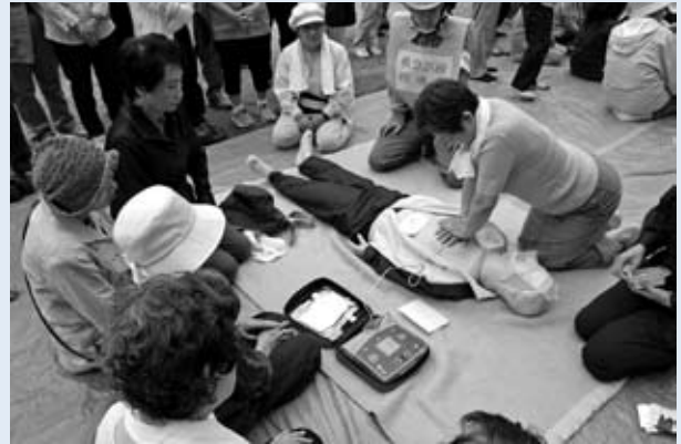
▲心肺蘇生・A E D（自動体外式除細動器）取扱訓練