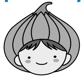
東区マスコットキャラクター「タッピー」