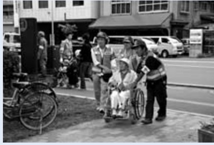
▲要援護者避難支援訓練

8月31日、鉄東地区（新生公園・北11条ことぶき公園・北13条たまごの公園）で東区防災訓練を開催。地域の皆さんや北光小学校の児童は、初期消火などの実技訓練を真剣な面持ちで体験しました。また、災害時要援護者名簿を活用した、安否確認・避難支援訓練も行われました。