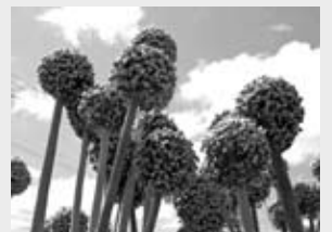
▲札幌黄は、この「ねぎぼうず」から毎年採種しています

きた先人たちの努力と歴史的価値が国際的に認められました。多くの市民に札幌黄の素晴らしさや作り手の努力などを理解していただき、さらに愛着を持って食べていただければ」と話します。