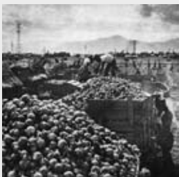
▲昭和40年代の収穫風景

明治初期、タマネギ栽培発祥の地、札幌で誕生し、全国に名をはせたタマネギ「札幌黄」。柔らかく、甘みと辛みのバランスがよいのが特徴で、昭和40年代まで主力の品種でしたが、効率的な生産が難しく、現在は市内で10数戸の農家が生産するだけです。