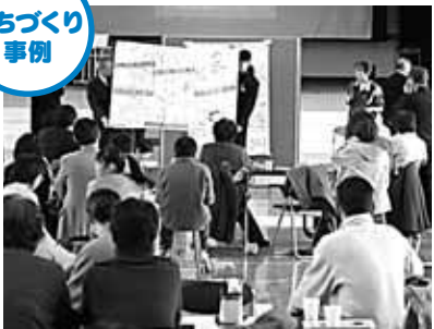
南区の石山地区では、住民同士が地域のまちづくりについて話し合うワークショップを開催しました

市民自治とは、「自分たちのまちのことを、自分たちで考え、決めて、行動していく」ことです