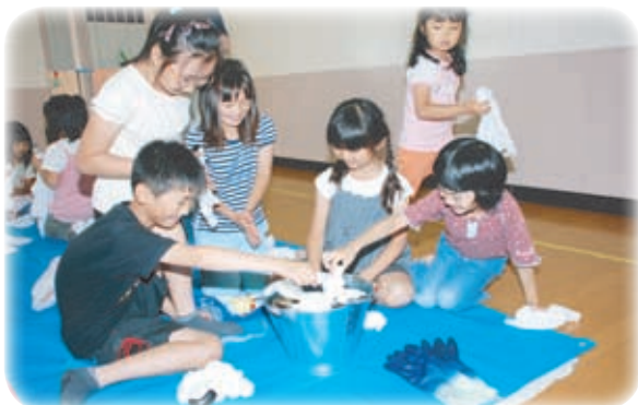
▲お父さんもきっと喜んでくれるね

子どもたちは、お父さんに感謝の気持ちを込めて、一生懸命に父の日のプレゼントを作りました。