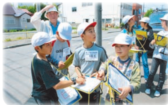
▲真剣な表情で危険な場所をチェックする子どもたち

児童たちは「犯罪者が入りやすい場所」や「道路から見えにくい場所」をキーワードに危険な場所や「子ども110番」の家など安全な場所を地図に書き入れていました。