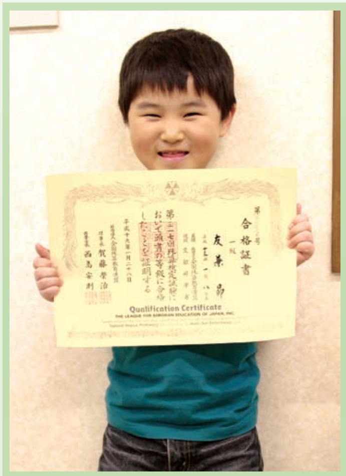
▲難関の1級に合格した昂君