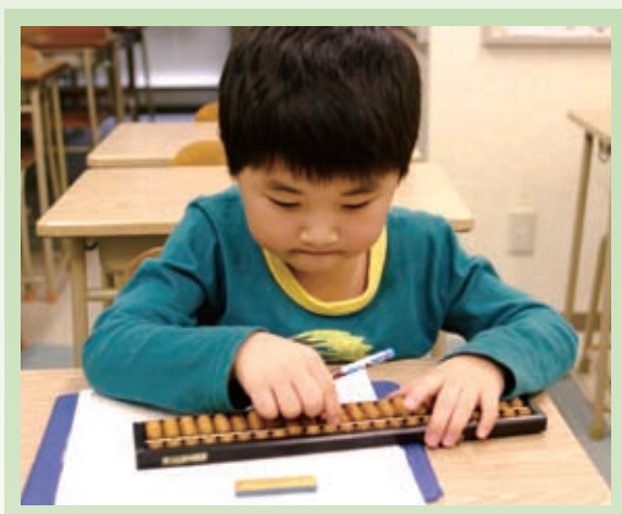
▲最高位の十段目指して毎日練習しています

昂君は今年1月に行われた珠算の検定試験で、未就学児としては道内でも過去数人しか合格していない1級を取得しました。