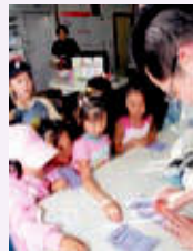
子ども11番の家 スタンブライー

子どもたちの地域への愛着やまちづくりへの関心を深めるため、児童会館事業を支援する方々のネットワークづくりに取り組みます。