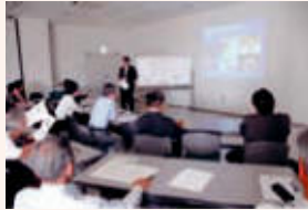
▲白旗山の魅力を考える会

町内会や学校などに花苗を配布するほか、ホテルの放流や観賞会を行います。また平成18年度に引き続き「白旗山の魅力を考える会」を行い、白旗山を拠点としたまちづくりの輪を広げていきます。