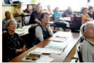
▲清田区民シニアスクール

高齢者のまちづくり活動への参加を支援するため、引き続き高齢者の生涯学習環境の整備に努めるとともに、地域と学校との連携や地域の人材を活用する仕組みづくりを進めます。