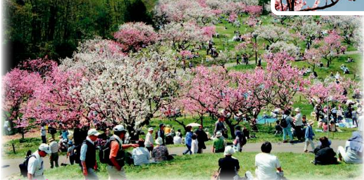
▲《写真》平岡公園の梅林(平成18年5月撮影)

～清田の春を告げる紅白の鮮やかな色彩～ 毎年5月に満開の時期を迎え、紅白に咲き誇った梅の花と甘い香りで多くの来園者を魅了する『梅の名所』平岡公園。特に今年は、夜間に梅林をライトアップして“夜梅”を楽しむ事業も試験的に実施します。何度も平岡公園に足を運んでいる方はもちろん、今まで行く機会がなかった方もぜひ一度来園して、春の訪れを感じませんか。