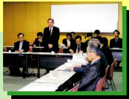
▲清田区10周年事業実行委員会

【構成団体】清田区各町内会連合会(北野、清田中央、平岡、清田、里塚・美しが丘) 清田区女性部連絡協議会、清田地区商工振興会、清田団地商店街協同組合、札幌清田ライオンズクラブ、札幌清田ロータリークラブ、清田区体育指導員会、札幌市清田区子ども会育成連合会、清田区老人クラブ連合会、新しい清田区の街づくりを考える住民の会、清田区緑の会、あしりべつ川の会、清田区災害防止協力会、清田区体育館・温水プール、清田区青少年育成委員会連絡協議会、清田区PTA連合会、札幌市小学校長会清田支部、札幌市清田中学校長会、札幌国際大学、清田区民センター運営委員会、清田区役所(順不同)