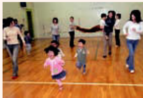
▲わくわく子育てセミナー

地域の子育てサロンを支援するとともに、子育てしやすい環境づくりを進めるため、子育て家庭や地域支援者の参画型となるよう事業を見直していきます。