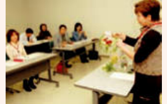
▲清田区民寺子屋ボランティア