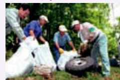
▲不法投棄物の撤去作業

子どもたちへの環境教育の充実を図るとともに、地域住民と行政が連携して不法投棄対策への取り組みを継続していきます。