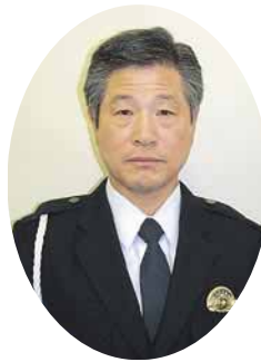
▲倉下交通第一課長

はとても重大です。絶対に事故を起こさないという自覚を持って、運転に注意を払ってください」 また車も歩行者も、お互いの行動に注意することができます。「特に交差点での左右の安全確認をしっかりと行ってください」と、倉下課長は話しています。