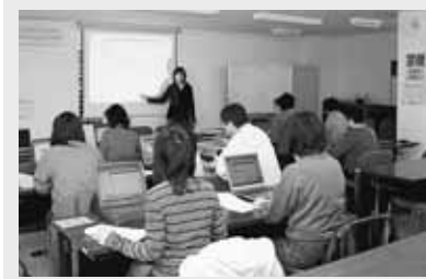
講座を開設して4年目となり、受講者のレベルも年々向上

地域の方が講師となり、パソコン講習を実施。ワード、エクセルからホームページ作成まで、幅広い講座を用意しています。まちセンはパソコンなどの機器の貸し出しを行いました。