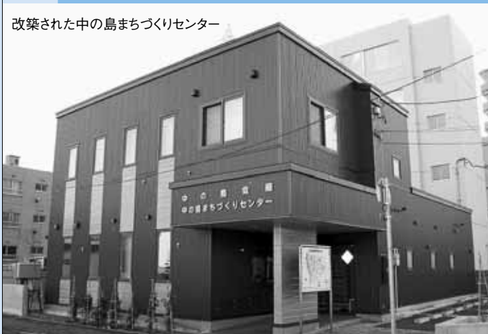
改築された中の島まちづくりセンター

施設の建て替えに当たり、平成16年度から、町内会やPTA、老人クラブなど地域の住民が議論を重ね、具体案を作成。調理コーナーなどを備え、事務室と住民の交流スペースが一体となった、開放感あふれるセンターが2月に完成しました。