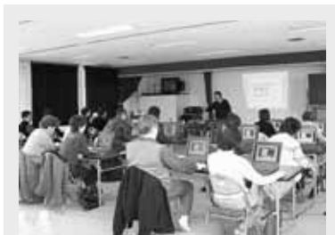
人気は上々で、定員の倍以上の申し込みがあるほど

パソコンに全く触れたことがない初心者を対象としたパソコン教室を開催しました。教室では電源の入れ方やマウスの動かし方など基本から指導。まちセンは、講師の選定や、会場の手配などを行いました。