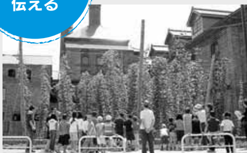
苗穂地区のサッポロビール博物館を見学

地域の子供たちに郷土意識を持ってもらえるよう、苗穂地区にある歴史的な施設の見学会「苗穂歴史探検隊」を開催しました。まちセンはバスの手配や施設との調整などを行いました。