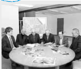
打ち合わせでは、思い出話に花が咲く