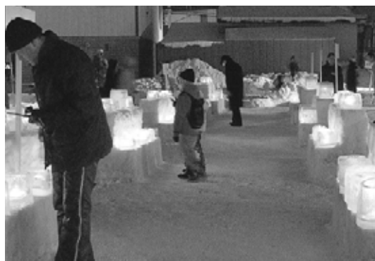
▲1,000個のアイスクャンドルの光が会場を幻想的な雰囲気に