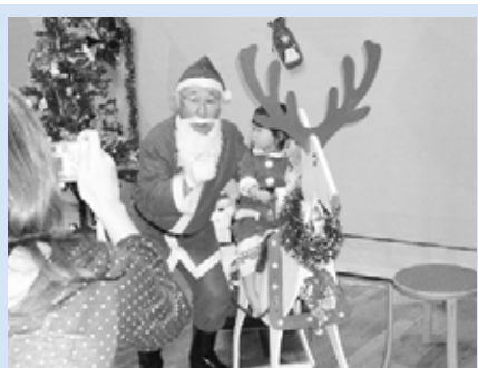
▲サンタさんと一緒に記念撮影

星置地区では、このほかに「ちびっ子運動会」や「新年交流もちつき大会」、子どもを犯罪から守る防犯パトロールなど、地域住民による子どものための事業が展開されています。