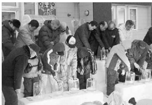
▲子どもたちによる点灯式で作戦開始!