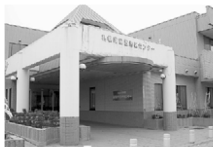
▲星置まちづくりセンター ☎695-3222