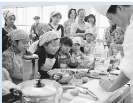
▲料理に興味津々の子どもたち