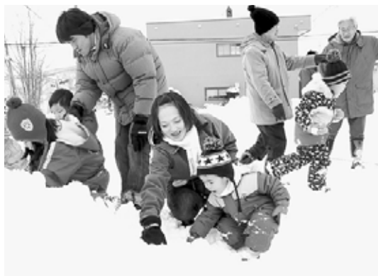
▲雪の中に隠されたミカンを探します