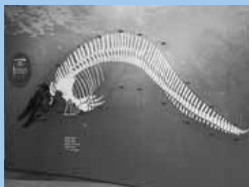
750万年前のハクジラ化石の模型

札幌の自然を学ぶ場であると同時に、市民の自然研究活動などを支援する施設です。展示や実習室が充実しており、解説員から展示の説明を受けることができます。