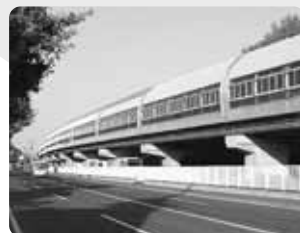
積雪対策と騒音防止対策を兼ねたアルミ合金製のシェルター

南北線は、1972（昭和47）年のオリンピック開催に間に合うように、急いで建設する必要がありました。そのため、建設費を抑え短期間で建設できる高架方式を採用したのです。