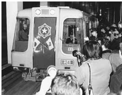
1971年12月16日の1番電車。当初は南北線のみで、北24条駅から真駒内駅までの12.1kmでスタートしました

札幌の地下鉄は、冬季オリンピック開催に向けて、1971（昭和46）年に誕生しました。現在の総延長は48.0kmで、公営地下鉄では大阪市、東京都、名古屋市に次いで全国で4番目の規模です。