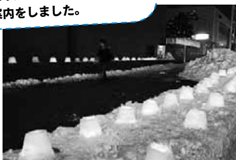
栄東地区の皆さんが作ったスノーキャンドルの優しい明かりが、夜の街を彩りました