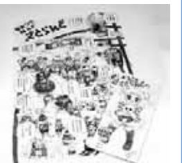
今年も好評だった 会場マップ