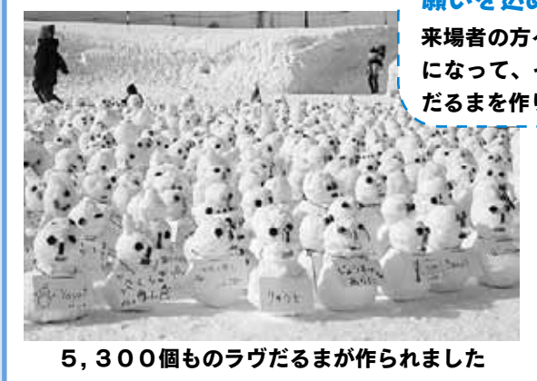
5,300個ものラヴだるまが作られました