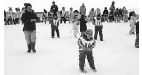
竹スキーおもしろ〜!