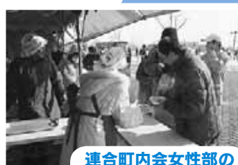
連合町内会女性部の 皆さんの豚汁販売