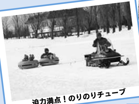
迫力満点! のりのリチューブ

札苗地区の「モエレまちづくり委員会」の皆さんが、竹スキーを手作り。挑戦した子どもたちは悪戦苦闘しながらも、今のスキーと違った滑り心地を楽しみました。