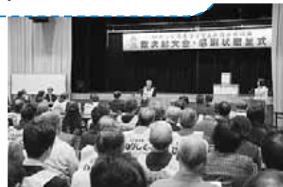
総決起大会には、町内会や企業、 団体など多くの関係者の方々が 集まりました