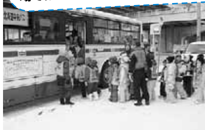
子どもたちをシャトルバスへご案内 (地下鉄新道東駅)

国内外からの来場者の方を温かく迎えるため、地域の皆さんが栄東地区の沿道をスノーキャンドルで飾り、地下鉄駅のシャトルバス乗り場では会場マップを手に、バスへの誘導案内をしました。