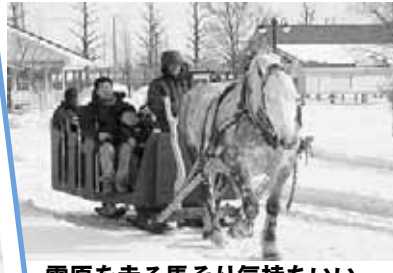
雪原を走る馬そり気持ちいい