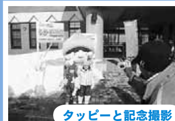
タッピーと記念撮影