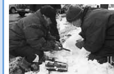
心を込めて点火作業