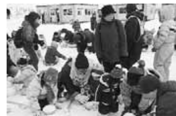
みんな一緒に雪だるま作り

来場者の方々とウェルカム協議会のスタッフが一緒になって、それぞれ願いを込めた5,300個の雪だるまを作り、ハート型に並べました。