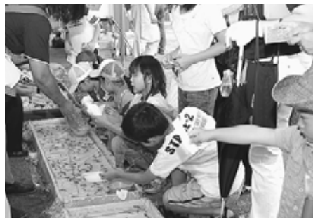
▲市電フェスティバル(緑日コーナー)

「ステイバル」の露店・緑日・バザーの共催参加や、市電と親しむ「市電ナイトフォーラム」の開催、札幌市と「道路アダプト・プログラム」協働契約を結び、違反広告物の除却など道路の環境美化活動を実施しております。