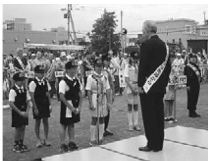
▲交通安全・防火・防犯・清掃の集い

山鼻地区は町内会連合会などを中心としたまちづくり活動を行っており、「交通安全・防火・防犯・清掃の集い」や「楽しいスキー教室」、「親子ミニバレーボール大会」、「親子雪遊び大会」など地域に定着し