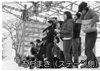
もちまき (ステージ側)