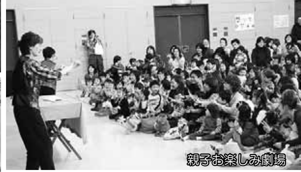
親子お楽しみ劇場