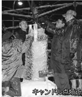
キャンドル点灯式