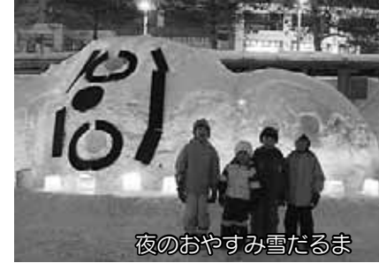
夜のおやすみ雪だるま