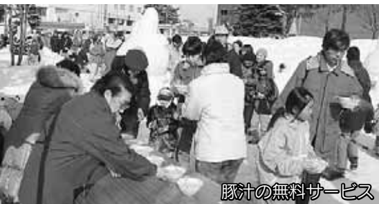
豚汁の無料サービス