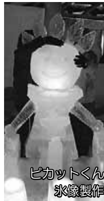
ピカットくん 氷像製作