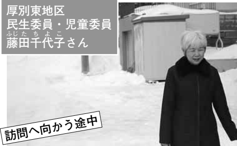
訪問へ向かう途中