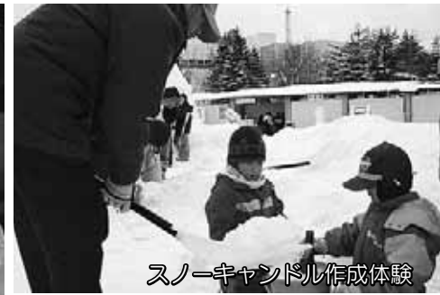
スノーキャンドル作成体験