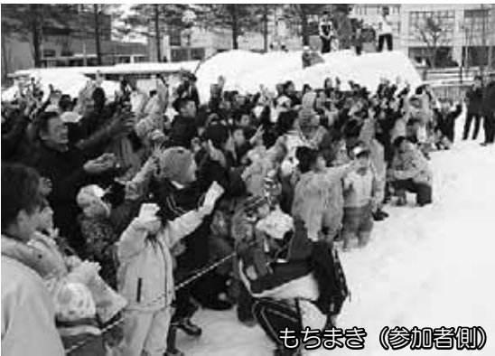
もちまき (参加者側)