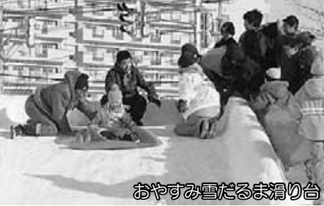
おやすみ雪だるま滑り台

2月2日(金)～4日(日)に「新さっぽろ冬まつり～あたたかい」が開催され、ふれあい広場あつべつや区民センター、サンピアザ劇場などを舞台に、3日間で約2万人の人出でにぎわいました。