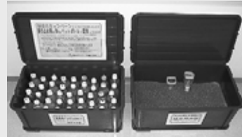
▲まちづくりセンターなどに設置