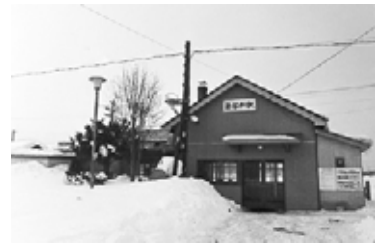
JR新琴似駅の駅舎 (昭和52(1977)年ころ)