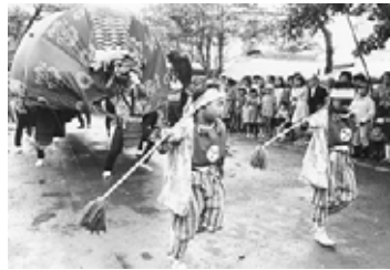
篠路獅子舞奉納の様子 (昭和49(1974)年ころ)

今回紹介したJR札幌駅北口など、区内十一カ所の「約三十年前」と「現在」の街並みを定点撮影した写真を展示する「北区・今むかし」をはじめ、北区の美しい風景や伝統文化などを紹介する「みてきて北区・写真展2007」を開催します。大きく引き伸ばした写真パネルで、北区の歴史と文化、そして自然に触れてみませんか。