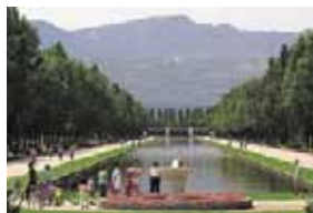
手稲山を望むカナルが見所です