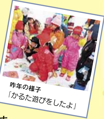
昨年の様子 「かるた遊びをしたよ」