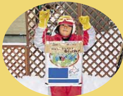
▲出来上がったビニールそり