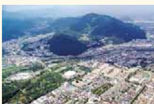
上空から見た○○○山周辺。