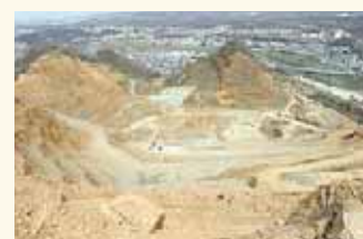
○○○○山。明治6年ころから採石が行われています。

21 取り締まりが強化されました。植物の繊維をすいて作る、メモをしたり、物を包んだりするもの。