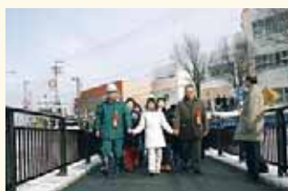
全長56メートル、幅員5メートルの歩道専用橋です。