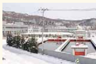
一日につくられる水道水の量は札幌市役所本庁舎約4杯分！