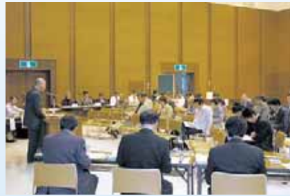
▲(仮称)清田区地区センター建設検討委員会住民説明会

・特色を重点化する ・将来を見据えて考える ・よりの多くの人が利用できる 仕組みをつくる 同施設の建設に当たっては、地域住民などで構成する「(仮称)清田区地区センター建設ワークショップ(勉強会)」のメンバーにより、