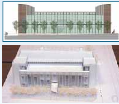
▲地区センターイメージ図(上)と模型(下)

ついて検討を行うため、平成十八年八月に地域住民、学識経験者、市・区役所職員など総勢四十二人で構成された建設検討委員会を設置し、利用者の視点から検討を重ね、平成十八年十月に基本設計案を作成しました。今回の住民説明会は、検討委員会が検討した基本設計案について広く区民に知ってもらうとともに、意見や新たな提案をしてもらうことで、より使いやすい施設とするために開催しました。説明会では、検討委員の代表者四人が、施設のコンセプトや各階のレイアウト、施設の外観など、委員会ですとめた基本設計案を紹介しました。