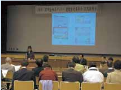
▲検討委員による基本設計案の紹介

その後、この構想案を基に、各室のレイアウトや設備などの内容や仕様のほか、利用者にとって必要な施設の機能に 最初の説明では、使いやすさや自然光の有効活用、防犯・防災といった設計の基本