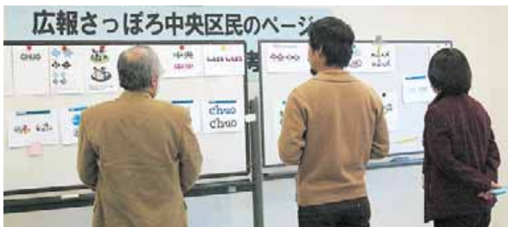
▲作品を並べて、優秀作品を選考中