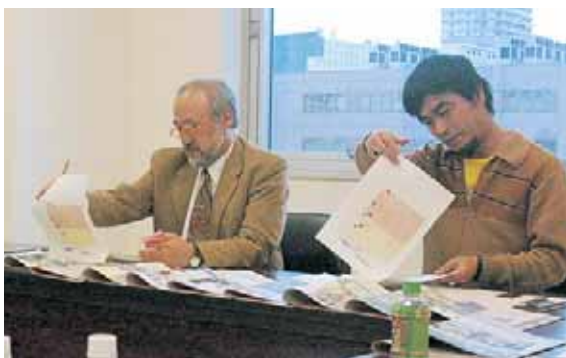
▲多数の作品から絞り込み

プロフィール 札幌市立大学デザイン学部教授。広告企画などを中心に授業を行っています。 全体の講評 若い人のエネルギーと何かトライしようとしているのが作品から伝わりました。作り手の意欲が感じられ、今後が期待できそうです。