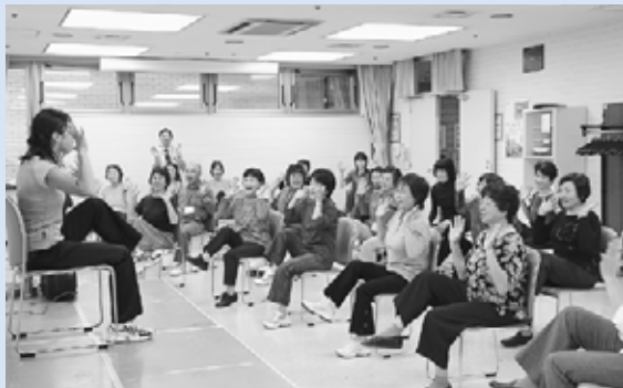
▲いすを使った軽体操で体をリフレッシュ

区民一人ひとりが健康の大切さについての理解を深め、それぞれに合った健康づくりに取り組むこと目的に手稲区が主催しました。