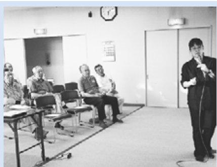
▲カラスに関する講演会

富丘西宮の沢地区は手稲区の南東に位置し、豊かな自然環境と交通の利便性の良さを併せ持つ住宅地を形成しています。 地区内では町内会を中心に各種団体が連携し、地域課題の解決やコミュニケーションの醸成に向けた取り組みを活発に進めています。今回は、そのうち二つの取り組みをご紹介します。 中の川桜づつみを歩こう会 平成10年から毎年、体育の日に、地区住民のふれあい交流と健康増進のため、地区全体の町内会主催で、歩こう会を開催しています。