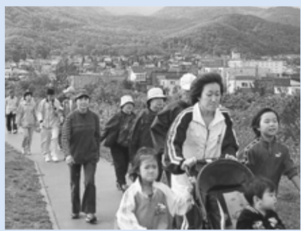
▲中の川桜づつみを歩こう会

富丘西宮の沢地区は手稲区の南東に位置し、豊かな自然環境と交通の利便性の良さを併せ持つ住宅地を形成しています。 地区内では町内会を中心に各種団体が連携し、地域課題の解決やコミュニケーションの醸成に向けた取り組みを活発に進めています。今回は、そのうち二つの取り組みをご紹介します。 中の川桜づつみを歩こう会 平成10年から毎年、体育の日に、地区住民のふれあい交流と健康増進のため、地区全体の町内会主催で、歩こう会を開催しています。