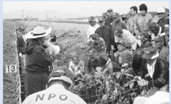
▲植樹の説明に参加者全員が注目します

山口緑地を市民の憩える豊かな森にすることを目的に実施されました。この日、同緑地内に広葉樹の苗約1万本が植えられました。