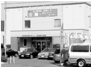
▲富丘西宮の沢まちづくりセンター ☎685-4745

1が町内会の協力のもと「カラスとはどのような鳥で、どのように対処したらよいか」を地域の方々に知ってもらうために、今年7月、鳥類の専門家を招き、講演会を開催しました。 講演会では、①巣は実害がなければ落とさない方が良く、巣を落とされ子育ての必要のなくなったカラスは暇になり、ゲーム感覚で悪さをすることが多い②ゴミ出しなどのルールを守ることで、人とカラスとの摩擦を少なくすることは十分可能、などの話に、参加者も真剣に耳を傾けていました。