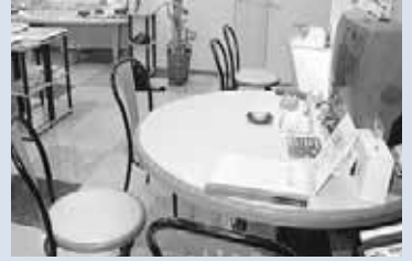
店舗内にある「ほっとひといきコーナー」