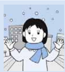
「藍ちゃんの区民の『声』、あれこれ」は、休載します。