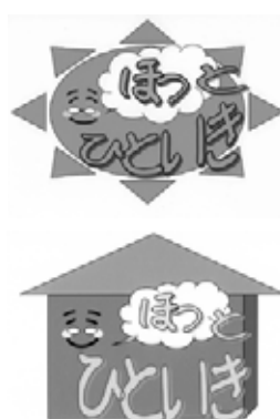
◀「ほっとひといきベンチ」を置いている店舗の目印