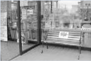
店舗入口にある「ほっとひといきベンチ」