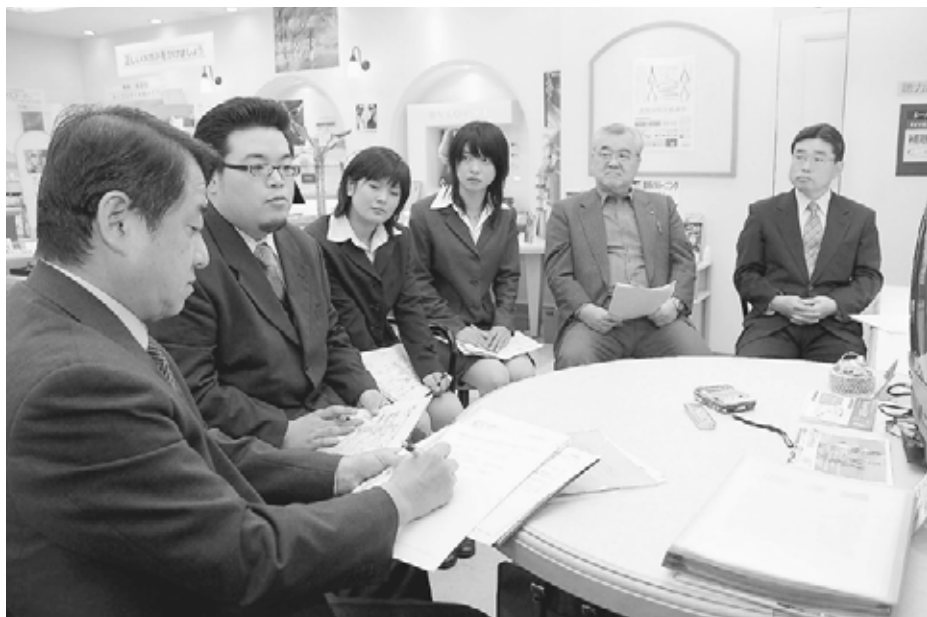
富士メガネ新琴似店内にある「ほっとひといきコーナー」で区長タウンミーティングを実施

区長 地域においてさまざまな人たちのつながりを深めることはとても大切なことです。例えば、最近、広がりを見せている安全で安心して暮らせるまちづくり活動はその一例です。近ごろ、子どもを巻き込んだ事件、事故が全国