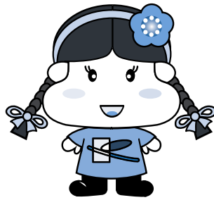
▲きよつちのお友達「きよみ」