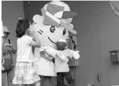
▲清田ふれあい区民まつりでは子どもたちに大人気!

今年七月の清田ふれあい区民まつりに登場したときには、子どもたちに大好評でした。今後も区の行事などに登場する予定なので、その時はぜひ探してみてくださいね。