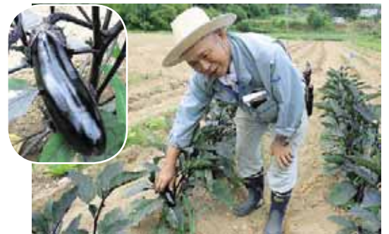
▲つやつやで皮も柔らかい自慢のナス