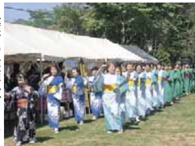
藤野ふるさとまつり