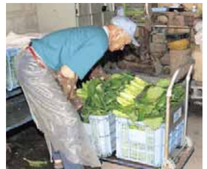
▲力仕事も多く、体にはこたえます