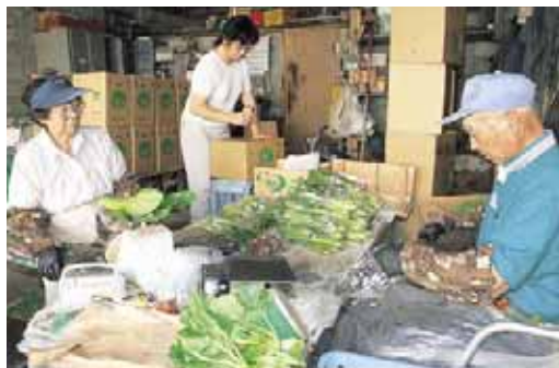
▲袋詰めや箱詰めは、手作業で丁寧に