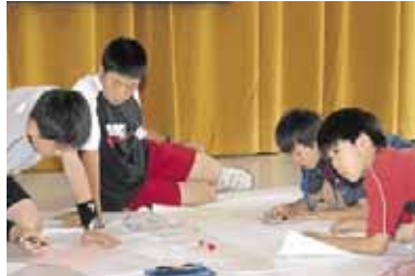
▲ここは人目に付きにくいから気を付けよう