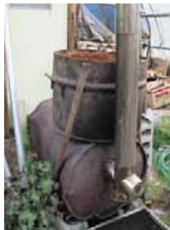
▲自作のまきストーブ