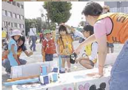
いっぱい遊んでもらって楽しかったよ!