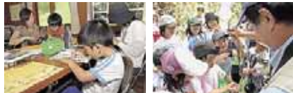
夏休み白旗山自然探検隊の様子

日は、朝から晴れ渡り、最高気温が三十度を超える暑い一日にもかかわらず、虫捕り網と虫かごを持った子どもたちの元気な声が、森の中を飛び交いました。この探検隊では、日本野鳥の会札幌支部会員の説明を聞きながら、親子で草花や昆虫の観察、採取をし、その後には、その後に標本作りや観察した昆虫のシールを地図に張りたりして、子どもたちの夏休みの自由研究を作成しました。