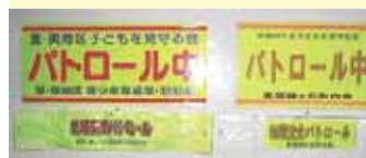
↑防犯パトロール 腕章・ステッカー