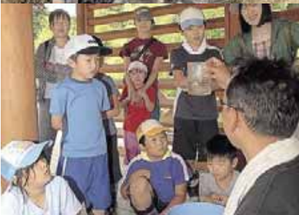
たくさんの生き物を捕まえ観察したよ!