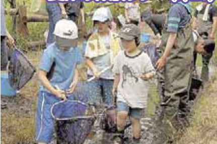
平岡公園 夏休み体験ツアー(7/29)