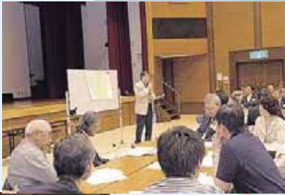
地域防犯ネットワーク 会議ワークショップ ↓→