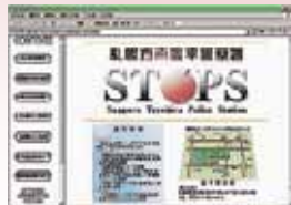
↑豊平警察署ホームページ

豊平警察署では、警察業務の紹介、管内の不審者情報や犯罪に巻き込まれないための注意事項などが掲載されたホームページを公開しています。