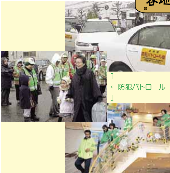
↑ ←防犯パトロール ↓

地域の防犯意識が高まる中、不審者の出没や犯罪の発生を未然に防ぎ、子どもたちの安全を守ろうと、各地区ではさまざまな防犯の取り組みが行われています。