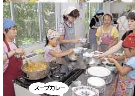
給食の人気メニューを作って食べたよ!