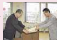
かわしま川崎石狩支庁環境生活課長(写真右)から感謝状を受け取る中野区長(写真左)

8月9日(水)、清田区は交通事故死ゼロ300日を達成し、北海道知事から感謝状が贈呈されました。交通事故死ゼロ300日は、昨年4月30日以来2年連続での達成となります。これからも引き続き、交通事故死ゼロ継続に向けて、交通安全を心がけましょう。