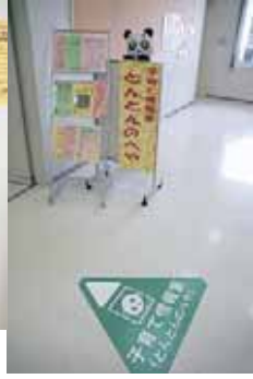
▲パンダの看板が目印！