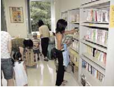
▲育児書や絵本も豊富にそろえています！

育児書・絵本・紙芝居などの貸し出しも行っていきます。また、子育ての相談などを保育士がお受けしますので、お気軽にお電話いただくか直接お越しください。パンダの看板が目印です。