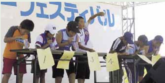
▲伏古・本町連合町内会20周年記念サマーフェスティバル (8/5~6)