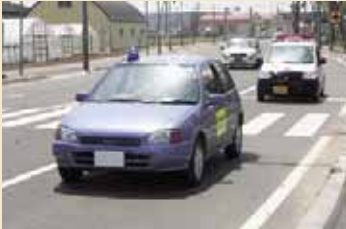
丘珠地区防犯パトロール隊 青色回転灯の車両で巡回

青色回転灯を装備した車両で巡回を行う地域や、おそろいのジャンパーや腕章を着用したり、自転車のかごなどに「安全パトロール」のプレートをつけたりして巡回を行う地域など、さまざまな方法で行われています。