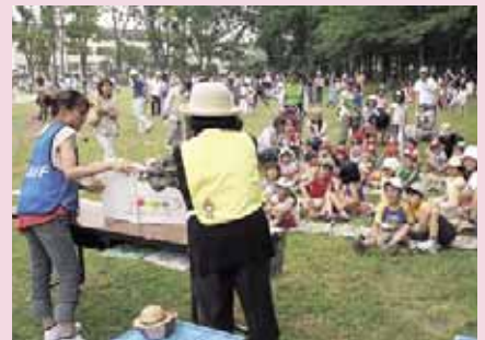
▲ひのまるちびっ子夏まつり (8/3ひのまる公園)