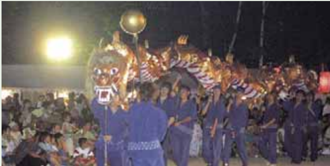
▲燃えれ! わが街2006 (8/5~6)