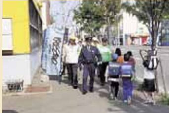
栄東地区「まもろー隊」