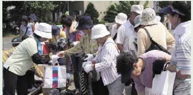
▲元町ふれあいサマーバザー (8/6)