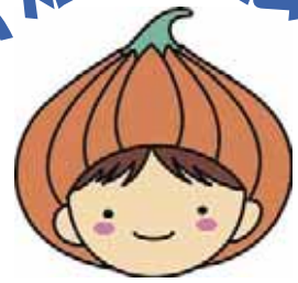
東区マスコットキャラクター「タッピー」