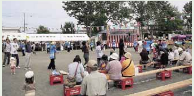
▲北栄連合町内会美香保夏まつり (7/15~16)