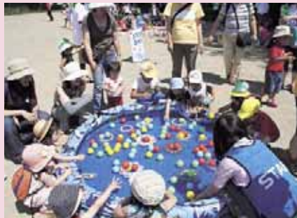
▲てっちい夏まつり (7/28新生公園・新生児童会館)