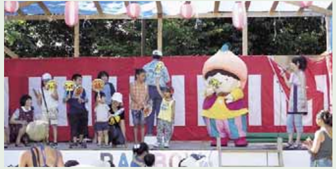
▲ザ・'06苗穂レインボーサマーフェスティバル (8/5~6)