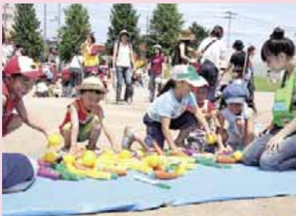
▲タッピー夏まつり (7/26元町小学校グラウンド)