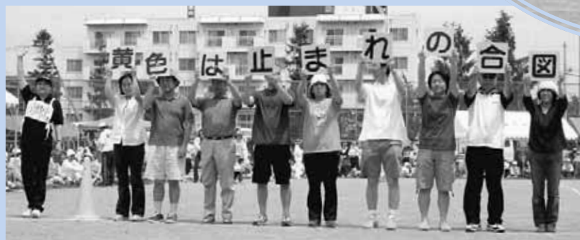
町内会ごとのチームで交通標語をつくる競争で、息の合ったプレーを見せる参加者の皆さん