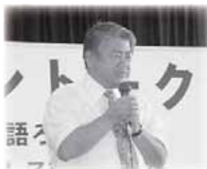
▲昨年のタウントークの様子

上田市長と市民の皆さんが直接対話し、市政情報の提供や意見交換を通じて、相互理解を深める「タウントーク」を開催します。