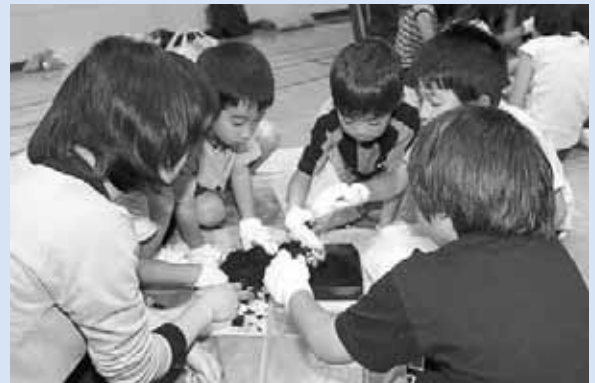
▲どんな虫がいるのかな？

真駒内五輪児童会館で「落ち葉のリサイクル」が行われ、約20人の子どもたちが参加しました。昨秋、エドウィン・ダン記念公園の「落ち葉の貯金箱」にためた葉をじっくりと観察。葉は、微生物の活動でボロボロになり、においては土のよう。子どもたちは手で感触を確かめ、落ち葉が土に還ることを学びました。