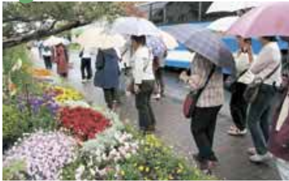
「昨年のガーデニング見学・体験バスツアーの様子」