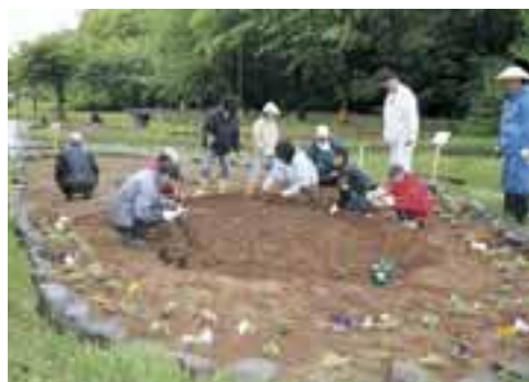
「青葉中央公園花いっぱい運動の様子」

青葉地区では、青葉中央公園を舞台にさまざまな活動を展開する青葉中央公園ジャック実行委員会が、活動の一つとして「青葉中央公園花いっぱい運動」を実施しており、公園内の空き花壇や植樹升に、地域の団体や小学校、児童会