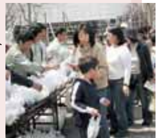
夢市場あつべつでの苗木配布

もみじ台フラワータウン事業【もみじ台】 厚別停車場通花いっぱい運動【厚別中央】 青葉中央公園ジャック【青葉】 記念植樹、苗木配布【厚別西など】 児童会館での 花壇作りや講習会【厚別東など】 歩道美化事業 （花の苗植え・管理）【厚別南など】