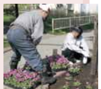
フラワータウン事業の花の苗植え