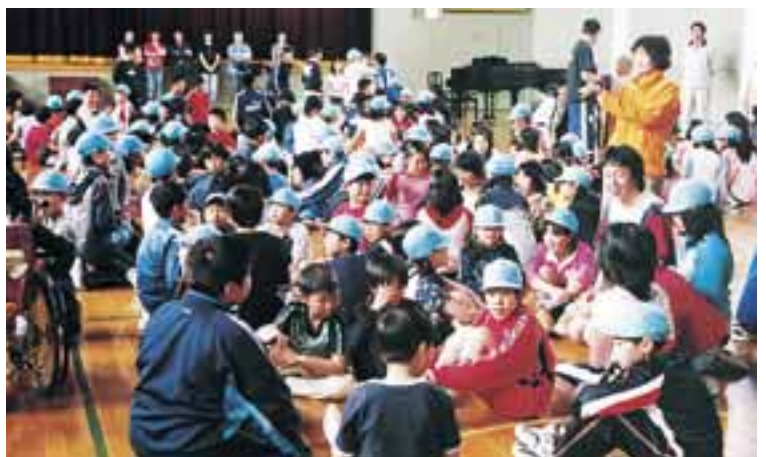
月形小学校体育館での交流会の様子です。

今回、植えたのはもち米「白鳥もち」の苗42,000株。苗床を滑らせながら次々と植えていきました。