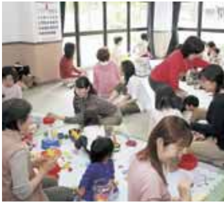
親子の笑顔が広がるサロンの様子です。

厚別南地区では、地域主体の子育てサロン活動が盛んです。大谷地東のマンション、パークシティ大谷地（五四六世帯）に、平成十七年一月にオープンした「パークパクビスケット」は、冬の遊び場が欲しい、乳幼児を連れて気軽にふれあえる場が欲しいというお母さんたちの声にこたえる形で生まれました。 地域の親子と一緒に遊べる場を作ることで、親子の関わりを深め、親子同士や異なる世代の住民との交流をしてもらおうとマンションの集会所であるセンターハウスを地域に開放して開催されています。パークシティ大谷地町内会