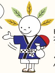
厚別イベントキャラクター ピカツトくん