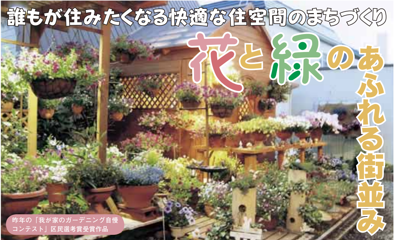
昨年の「我が家のガーデニング自慢コンテスト」区民選考受賞作品