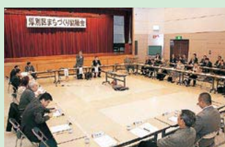
厚別区まちづくり協議会

まちづくりセンターの機能強化や区民との協働の仕組みづくりに取り組み、区民のまちづくり活動への支援をさらに強化します。