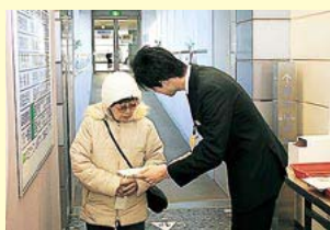
来庁者アンケート