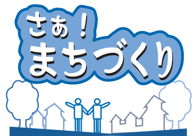
～第1回白旗山の魅力を考える会～

緑 豊かな清田区を象徴する白旗山の都市環境林。区面積の約六分の一をこの林が覆っています。国際的なスキー競技の祭典「ノルディックスキー世界選手権大会」。オリンピックに匹敵するこの大会が来年二月、地元・白旗山で行われます。区ではこの機会に、白旗山をまちづくりに生かそうと、その方法について区民の方とともにアイデアを出し合う場を設けることにしました。