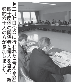
三月七日(火)に行われた「考える会」。四十団体の関係者と個人を含め、総勢約六十人の方が参加しました。

参 加者一人一人による自己紹介では「長く住んでいるが一度も行ったことがない」「いろんな散策ルートがあり、何度行っても飽きない」など、白旗山についての率直な感想も出されました。また、大学関係者からは「次回の会合には学生を連れて来たい」との頼もしいコメントもあり、まちづくりの輪が広がっています。 会 せいただいたお二人の方も快く参加してくださいました。では、白旗山の植林事業や見どころ、競技場の利用状況などの説明があり、白旗山を舞台に自然観察やウォーキングイベントなどを実施している団体も活動内容を紹介。参加した皆さんは、白旗山でのまちづくりの現状について理解を深めました。 詳細 地域振興課まちづくり推進係 ☎(889)2400 内線222