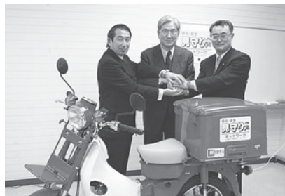
▲協力と連携を誓いました