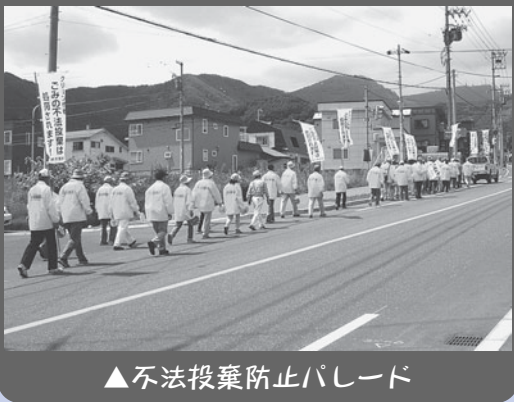
▲不法投棄防止パレード

富丘西宮の沢地区は手稲区の南東に位置し、地区中央を国道5号と二十四軒・手稲通の2つの幹線道路が走る、恵まれた自然環境と交通の利便性の良さを併せ持つ住宅地を形成しています。 地区内には、富丘、西宮の沢の2連合町内会と29の単位町内会があり、地域課題の解決や地域コミュニティの機運をより高める取り組みを各種団体と連携し、活発に進めています。