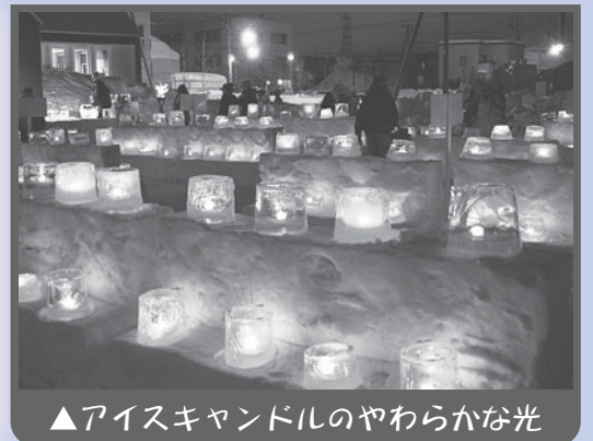
▲アイスク্যান্ডルのやわらかな光

会館前広場をメイン会場に、手作りのアイスク্যান্ডル約千個を点灯する『2006アイスク্যান্ডル大作戦』が開かれ、大盛況のうちに終わりました。このイベントは、子どもたちの心に残るような冬のイベントを通して、地域交流を深めていこうと、連合町内会が地区内の各種団体の協賛・協力を得て企画実施したもので、昨年引き続き2回目の開催となりました。 このように、富丘西宮の沢地区では、地域の人々がテーマに応じてネットワークをつくり一つの目標に向かって活動したときに、大きなエネルギーが生まれることを実感できます。