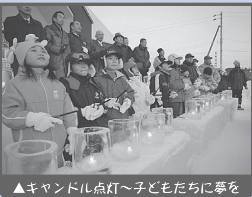
▲キャンドル点灯～子どもたちに夢を

富丘西宮の沢地区は手稲区の南東に位置し、地区中央を国道5号と二十四軒・手稲通の2つの幹線道路が走る、恵まれた自然環境と交通の利便性の良さを併せ持つ住宅地を形成しています。 地区内には、富丘、西宮の沢の2連合町内会と29の単位町内会があり、地域課題の解決や地域コミュニティの機運をより高める取り組みを各種団体と連携し、活発に進めています。