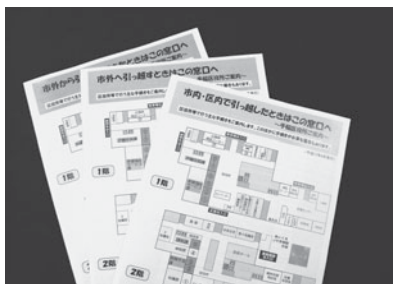
▲情報提供リーフレット