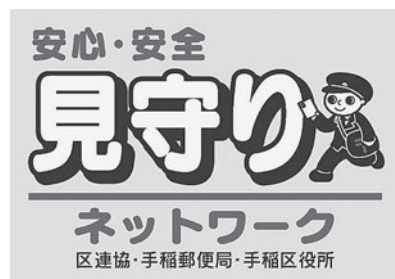
▲このステッカーが目印です