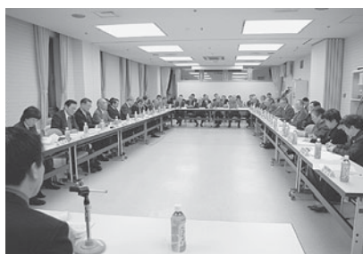
▲会場に集まった多くの方々

地域のさまざまな力を結集した「ていねっていいね!区民の集い」において、安心・安全なまちを目指し「みんなで創ろう犯罪のない“ふるさと手稲”宣言」が採択されました。