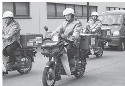
▲区内各地にむけて出発です