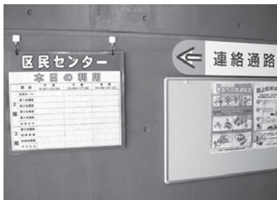
▲新設された催事案内の掲示板

各月ごとに、区役所の意見箱に寄せられた投書も含め、職員の市民対応・接遇に関する市民の声を集約し、全ての区役所職員に周知することにより、市民意見の共有化を図っています。