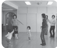
子育てサロンはたくさんの親子の交流の場。子育てに関する情報交換ができます