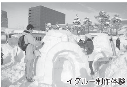
イグルー制作体験