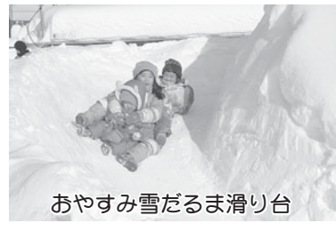
おやすみ雪だるま滑り台

2月3日(金)~5日(日)に厚別区の新な冬のイベント「新さっぽろ冬まつり~あたたかい えびそ~どわん」が開催され、ふれあい広場あつべつや区民センター、サンピアザ劇場などを舞台に、3日間で約1万人の人出でにぎわいました。