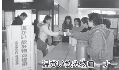
温かい飲み物コーナー