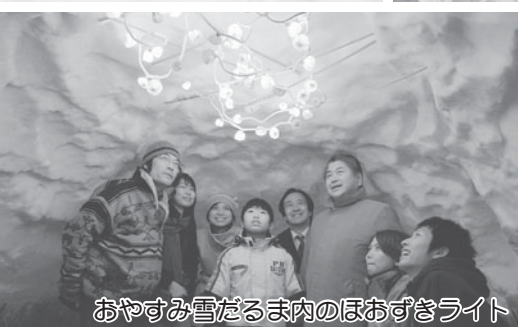
おやすみ雪だるま内のほおずきライト