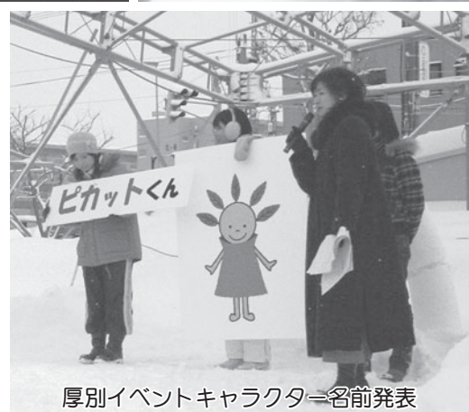
厚別イベントキャラクター名前発表

厚別区ホームページ ( http://www.city.sapporo.jp/atsubetsu/ ) に新さっぽろ冬まつり写真館のページがありますのでご覧ください。