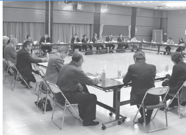
第5回もみじ台まちづくり会議（2月10日）