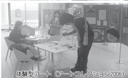
体験型アート (アートコレクション2006)