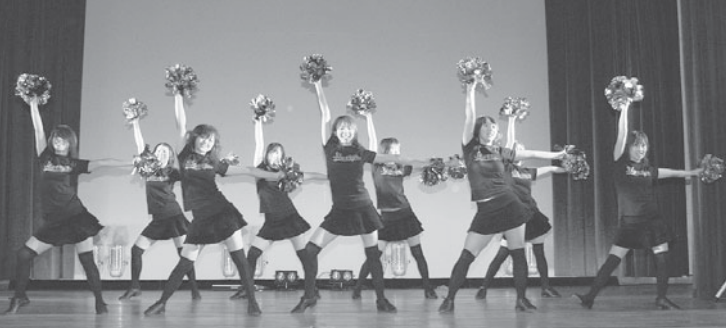
チアダンス (アートコレクション2006)