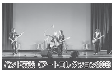
バンド演奏 (アートコレクション2006)