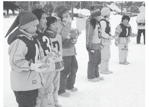
寒いと雪玉が硬くなるので、代わりに、雪合戦専用のボールを使うこともあります。

今年 は 一月二十九日に大会が開催されます。昨年 の 十二月には屋内で、雪合戦のルール の 学習と練習を行い、準備をしてみました。