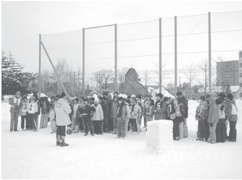
昨年 の 雪合戦大会の様子 ～大勢の子どもたちが集まりました。

厚別南地区では、昨年 から 雪合戦大会が行われています。主催は厚別南町内会連合会、運営は上野幌体育振興会と上野幌中央体育振興会です。体育振興会は、地域住民の健康増進のためさまざまな体育行事の運営を行っています。が、冬季の新しいスポーツの普及と子どもたちの健全育成を目的として、上野幌西小学校のグラウンドで雪合戦大会を始めることになりました。