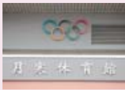
外壁には五輪のマーク(オリンピックシンボル)

昭和四十七年二月に開催された札幌冬季オリンピック。市内にはこの大会のために造られた施設がいくつもあります。その一つが月寒体育館です。月寒体育館があった場所は、戦前は歩兵第二十五連隊の練兵場でした。昭和二十五年には月寒競輪場が開設され、多くの人々にぎわいましたが、昭和三十六年に競輪場が廃止された後は、運動広場として利用されてきました。 その後、札幌での冬季オリンピック開催が決定し、昭和四十六年、この場所に「月寒屋内スケート競技場」が建設されました。 札幌でオリンピックが開催された当時の氷上の競技は、スピードスケート、フィギュアスケート、アイスホッケーの三競技でした。このうち、月寒屋内スケート競技場では、アイスホッケー競技が十試合行われ、訪れた観客が世界最高のレベルに魅了されました。 オリンピックが終了後は、「月寒体育館」