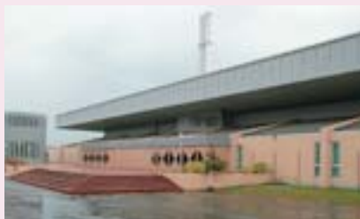
現在の月寒体育館

昭和五十四年からは、一年をとおしてスケートリンクを使用できるようになり、多くの個人、団体が一般スケート、フィギュア、アイスホッケーに利用しています。 平成十五年に大規模な改修工事が行われ、ますます利用しやすくなった月寒体育館は、オリンピックがもたらした貴重な財産であるとともに、身近でスポーツやレジャーを楽しめる施設として、これからも多くの市民に親しまれていくことでしょう。