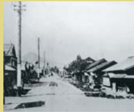
琴似駅付近の街並み（大正13年ころ）