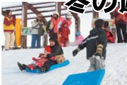
熊の沢公園でのワイワイ冬フェスタの様子