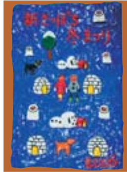
冬まつりイメージレリーフ (原田ミドーさん作)