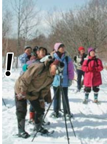
野幌森林公園でのかんじきウオークの様子

今年も寒くて長い冬がやってきました。寒いと外に出る時間を短くしたくなるものですが、雪が降るからこそできる遊びもたくさんあるはず。北国ならではの遊びで冬の思い出をたくさん作りましょう。