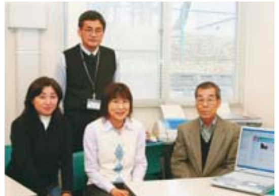
いろいろと話し合いながら、和気あいあいと、楽しくホームページを運営しています。

厚別東地区には、まちづくり会議の様子や地区の行事予定、行事の様子などを情報発信するホームページがあります。地域のイベント情報を素早く発信することで参加者を増やしたい、住民の地域活動情報を共有したいという地域住民の要望から、自宅でもいつでも確認できる手段として、住民の有志が同地区のホームページを作るようになりました。 運営スタッフは、地域の方三人で、まちづくりセンター所長がサポートし、今年の八月十七日にホームページを公開しました。 公開後は毎月一回集まり、運営方法の打ち合わせをするほか、スタッフ自ら地域の情報を収集・取材し、