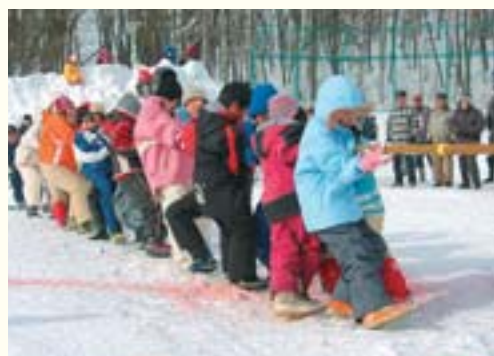
青葉地区の運動会の様子。リレー競走や綱引き対抗戦などで盛り上がりました。

また、公園では普段も雪遊びや斜面を利用したそり滑り、スキューの練習などをして遊ぶことができます。