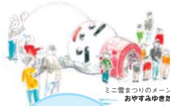
ミニ雪まつりのメイン雪像 おやすみゆきだるま