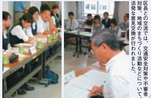
区長との交流では、交通安全対策や不審者対策、地域のまちづくり活動などについて、活発な意見交換が行われました。

9月3日、区民センターに、区内10校の中学校生徒会が集まり、意見交換を行いました。豊平区長も参加し「ぜひ、地域や区役所と一緒に、まちづくりを盛り上げましょう」と、学校同士の連携やまちづくり活動を支援していくことを約束しました。