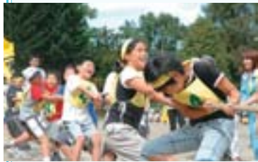
町内会対抗で行われる「大運動会」。綱を引く手にも力が入ります。