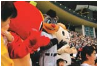
「こりん」「めーたん」とB・Bの競演！子どもたちに大人気でした

■ 球団が豊平区民を招待 地域に密着した球団を目指すファイターズ。道民や区民を対象にした割引入場券「なまら！超割チケット」を販売するなど、地元ファンの拡大に積極的に取り組んでいます。このような中、球団から区役所に、豊平区民2千人を札幌ドームに招待したいとの話が