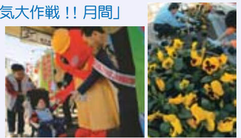
これまでの「とよひらの日」では、市税や国民健康保険料の口座振替PR、区役所前の植花などを行ってきました。

毎月14日の「とよひらの日」や、まちづくりのイベントを9月と10月に集中して行う「とよひら元気大作戦!! 月間」を、区民の皆さんにアピールし、全区的な取組みを展開します。