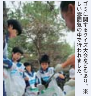
ゴミに関するクイズ大会などもあり、楽しい雰囲気の中で行われました。

陵陽中学校から、区役所へ提案があった「とよひらおそうじ隊」。9月1日に生徒、地域の方々、区役所が協力して、月寒公園の清掃を行いました。詳細は、本誌全市版4ページをご覧ください。