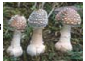
毒きのこの1種テンゲタケ