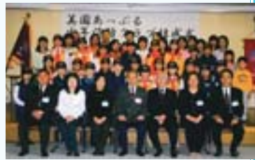
「美園あつぷる少年消防クラブ」の結団式。豊園小学校、美園小学校、みどり小学校の児童25人が参加しています。