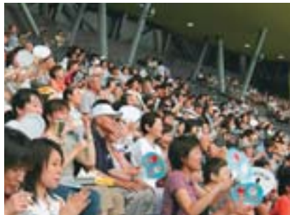
「こりん」「めーたん」のうちわで応援！