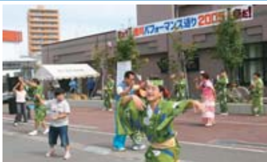
▲みんなで踊ると楽しいよ!

「澄川パフォーマンス通り」は今年で3回目。猿回しや腹話術、スクールバンドや阿波踊りなど、さまざまなパフォーマンスが繰り広げられ、秋の一日を楽しみました。