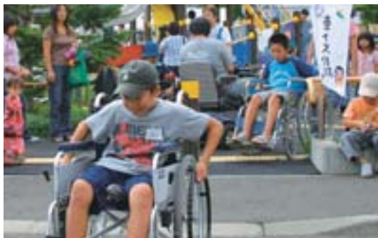
▲思ったより力があるんだね

市内初のバリアフリー公園「藤野むくどり公園」で開園9周年記念会が開かれました。参加者は、障がいのある人の立場になり、点字や車いすなどを体験しました。