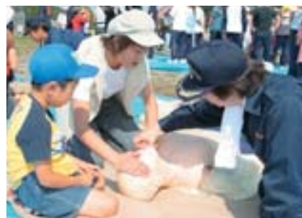
◀しっかりと覚えなくちゃ!