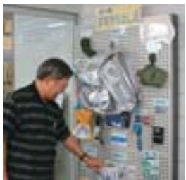
◀これは便利そうだな