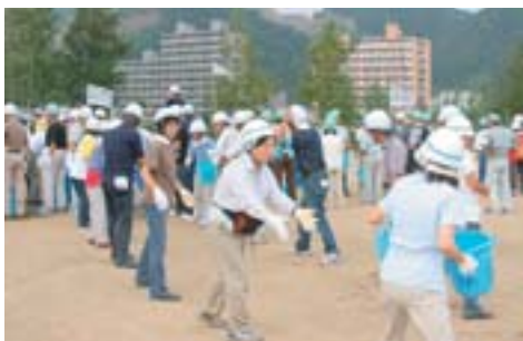
◀力を合わせて焦らずに