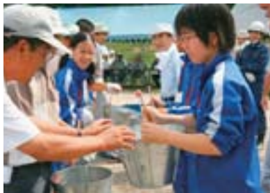
▲バケツリレー訓練