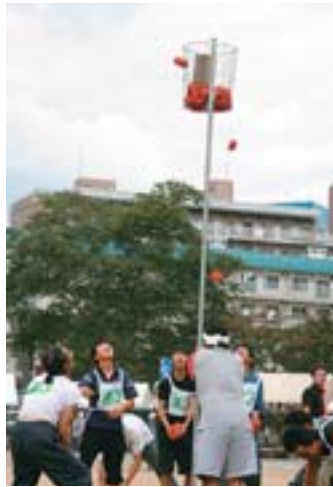
▲第52回鉄東地区市民大運動会