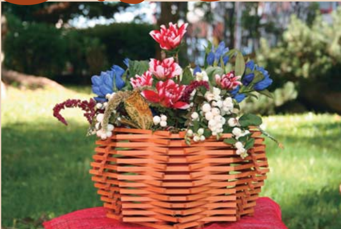
▲程よい茶色に仕上がった花籠 かご