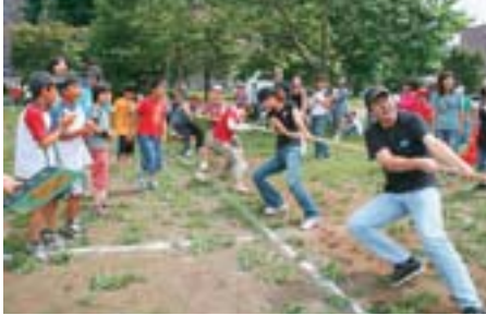
▲第32回苗穂連町ふれあい運動会

8月28日、苗穂地区と鉄東地区で運動会が行われ、地域の皆さんの元気な掛け声が響きわたっていました。