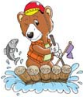
▲イカダ下り大会のマスコットキャラクターの「豊吉」