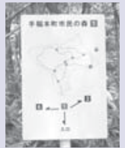
【いろいろなコースが楽しめます】

山男 足跡みたいなのがあるけど、あれは何かな？ 川雄 あれは、鹿の足跡だね。手稲山に住んでいる鹿がこの辺りまで降りてくるんだよ。 山男 手稲山って鹿も住んでいるんだあ。 川雄 手稲山は自然がいっぱいだから、鹿だけじゃなくて、いろいろな野生動物が住んでいるんだよ。でも、熊もよく目撃されているから、登山のときは、気を付けないとね。 山男 だから、お兄さんは熊よけの鈴を持っているんだね。