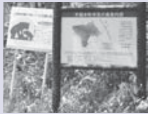
【手稲本町市民の森入口】